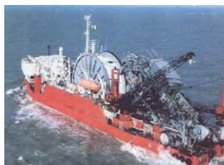
13Cr系ラインパイプの敷設状況