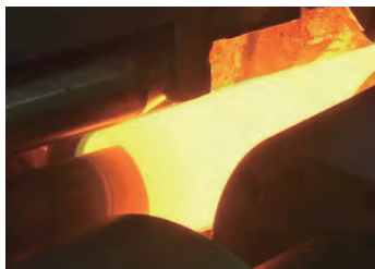
継目無鋼管の穿孔実験 (油井管・ラインパイプ向け)

高周波電縫鋼管の高信頼性溶接技術、継目無鋼管の高寸法精度加工技術、鋼管プロセスを活用した材質制御など、最先端プロセス技術開発を通して、お客様の信頼に応えます。