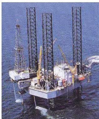
Cr系油井管使用の海底油田

近年、石油、天然ガスの掘削環境は苛酷でかつ高深度化しており、材料に対する要求は非常に厳しくなっています。そのため、耐食性に優れた鋼管のニーズは年々高まっています。こうした要求に対し、耐食性に優れたステンレス油井管、高強度カーボン耐サワー油井管、ラインパイプの新製品を開発し、世界中の石油天然ガス開発に貢献します。