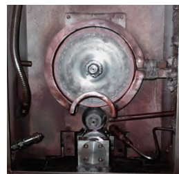
熱間摩耗シミュレーター