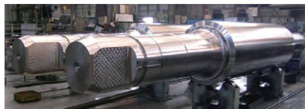
遠心鋳造製ハイスロール

鉄鋼圧延製品の高級・高品質化に伴い、熱間圧延用ロールに要求される特性や品質は厳しくなっています。それに応える、耐摩耗・耐肌荒れ性に優れた遠心鋳造製ハイスロールを開発し、圧延技術の進歩に貢献します。